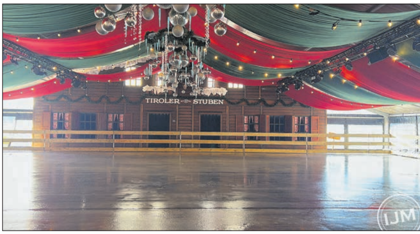
IJM's Winterparadijs; de plek waar gezelligheid en een winterse ambiance samenkomen!