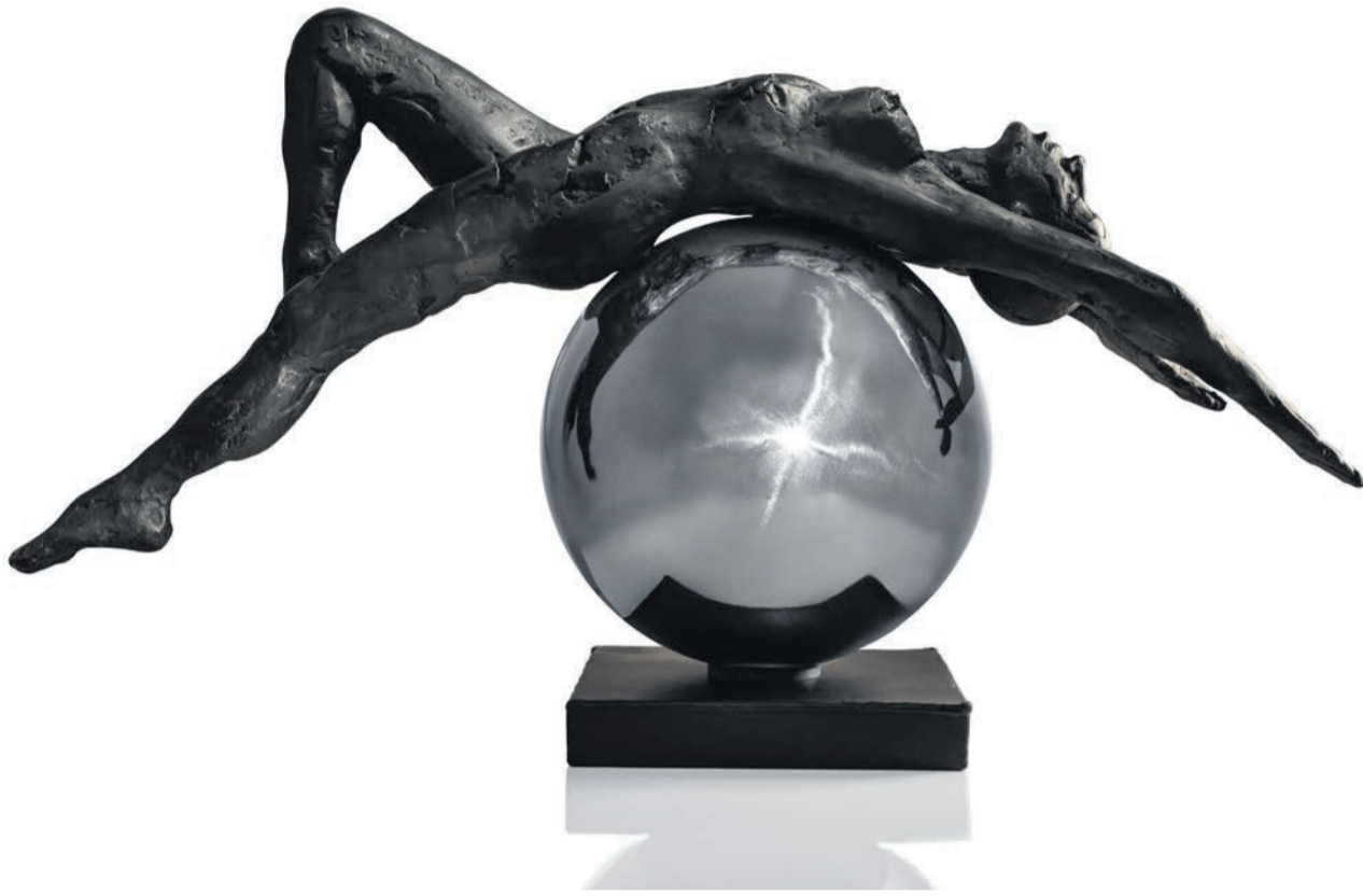
Beautiful Madness, 2024, Marek Zyga, brons, 70 x 20 x 20 cm