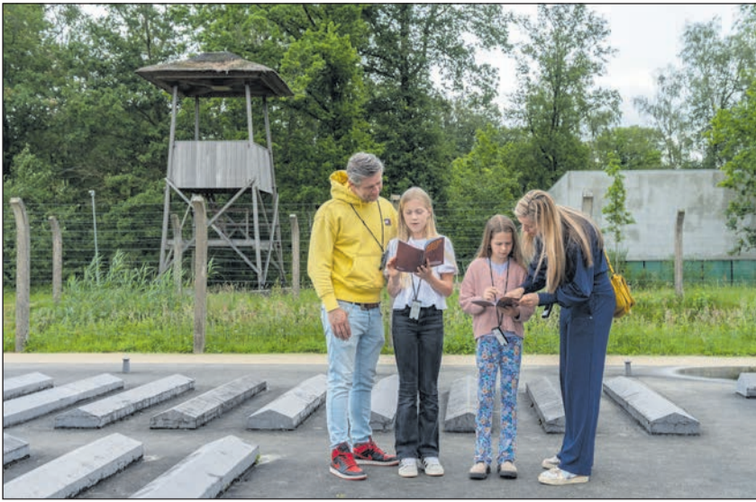
Bezoekers in Nationaal Monument Kamp Vught